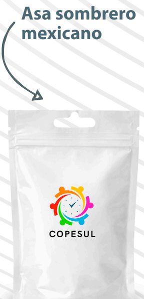
Asa sombrero mexicano