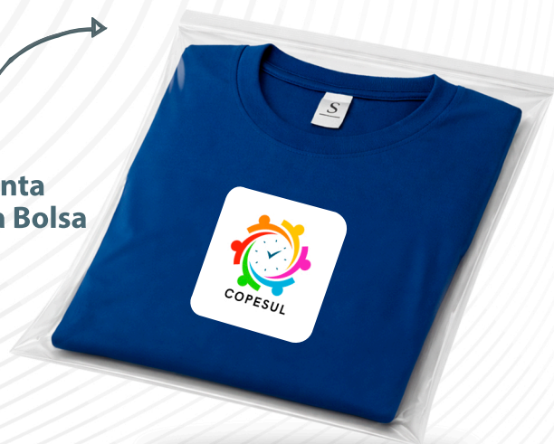
Sin Cinta Cierra Bolsa